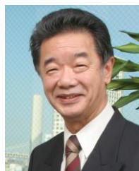
志賀一雅 MWT 総合監修 工学博士

脳力開発研究所 相談役 日本におけるメンタルトレーニング指導の第一人者。83年に脳力開発研究所を設立、現在は一般社団法人メンタルウェルネストレーニング協会会長をはじめ、多岐にわたりメンタル(ウェルネス)トレーニングの普及に尽力している。他多数。2011年3月米国保健社会福祉省より長年の研究・実践に対し金賞を授与される。著書多数